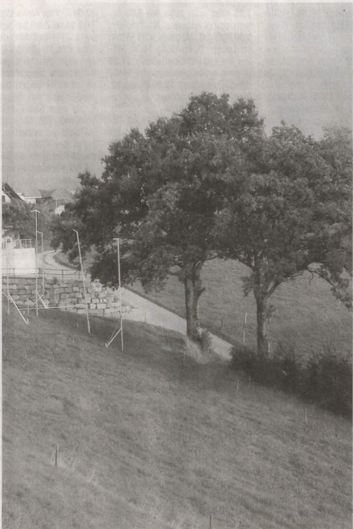
Die Eichen vor (l.) und nach dem Schnitt.